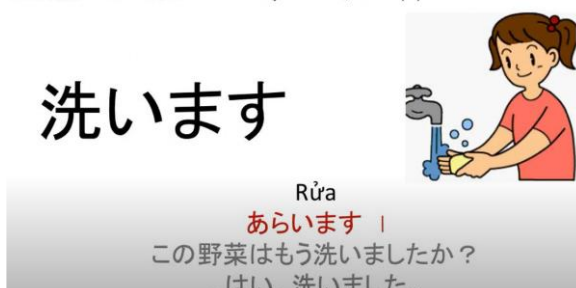
日本語勉強教材の提供