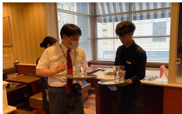
市が尾トレーニングセンターでの初期トレーニングの様子（初期トレーニング後、各店舗へ配属）